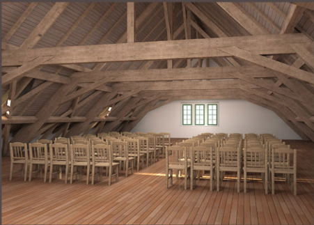
Projet de restauration du volume des combles, photomontage

La rénovation de la toiture du bâtiment de l'hôtellerie a impliqué une intervention complète touchant la structure de la charpente, la couverture et ferblanterie, l'isolation thermique ainsi que quelques éléments secondaires de menuiserie. A la base, l'opération fut motivée par un problème de dégradation de la couverture et le souci de préservation de l'édifice. Mais c'est une opération exhaustive qui a été pour finir entreprise et don les grandes lignes sont : - Remise en état de la charpente déstabilisée par les interventions de 1872 et 1908 (pièces coupées par le passage de cheminées, cohérence altérée en détachant les chevrons du faux-entrait supérieur, dégradations diverses) - Restitution de la pente d'origine et remettant les chevrons anciens à leur place d'origine - Restitution de la croupe d'origine du côté sud et création d'un pignon droit du côté nord pour marquer la section du bâtiment en 1872. - Réfection complète de la couverture et de la ferblanterie. Remise en état du paratonnerre - Isolation thermique - Ces travaux ont été entrepris après des travaux indispensables de consolidation de maçonneries (liaison par ancrage de la façade sud au reste du bâtiment)