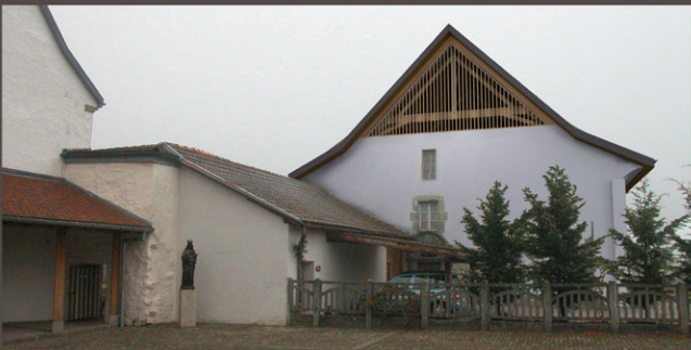
Projet de vitrage et claire-voie du pignon nord, photomontage