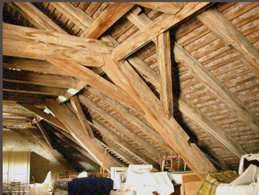
Charpente de 1695 : la base des fermes a été maintenue mais les chevrons sont pivotés lors des travaux de 1908