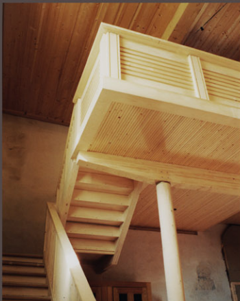
Tribune occidentale, dalle massive en bois