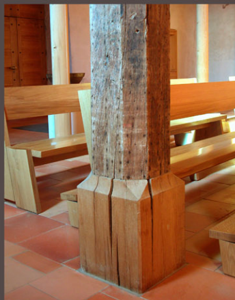
Base d'un pilier en chêne restauré