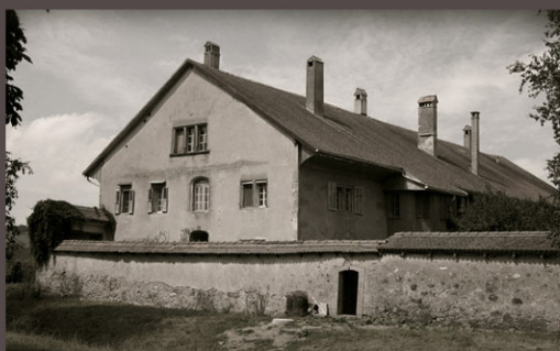
L'hôtellerie, vue depuis le sud-est avant travaux de restauration

Le bâtiment de l'hôtellerie est une pièce importante du complexe monastique de la Fille-Dieu. Ce bâtiment long de près de 50 m fut édifié en 1695 – 1711 sur les restes du premier couvent médiéval.