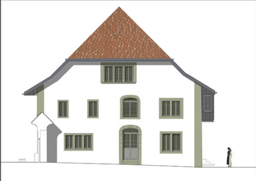
Elévation sud, projet