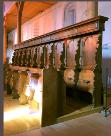
Les stalles de 1618 remontées dans la nef