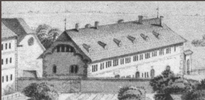
Le bâtiment de l'hôtellerie vu depuis le nord-ouest, dessin E. Curty 1780