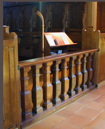
Barrière récupérée dans l'ancienne hôtellerie